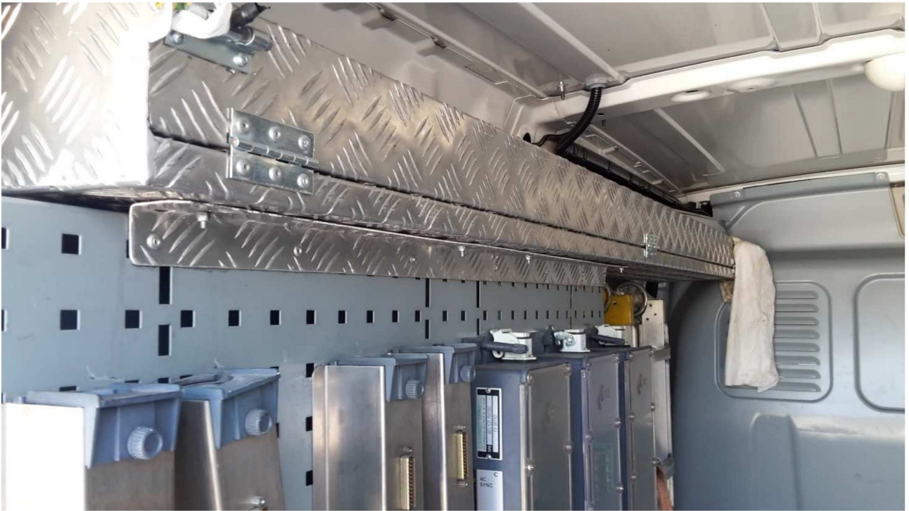
Figura 7 –Vista Vano Carico Laterale Sinistro