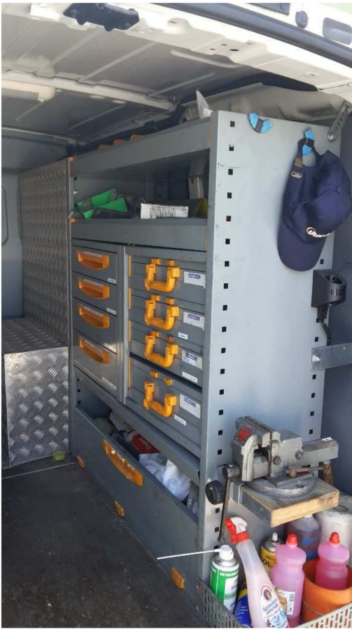
Figura 8 - Vista Vano Carico Laterale Destro