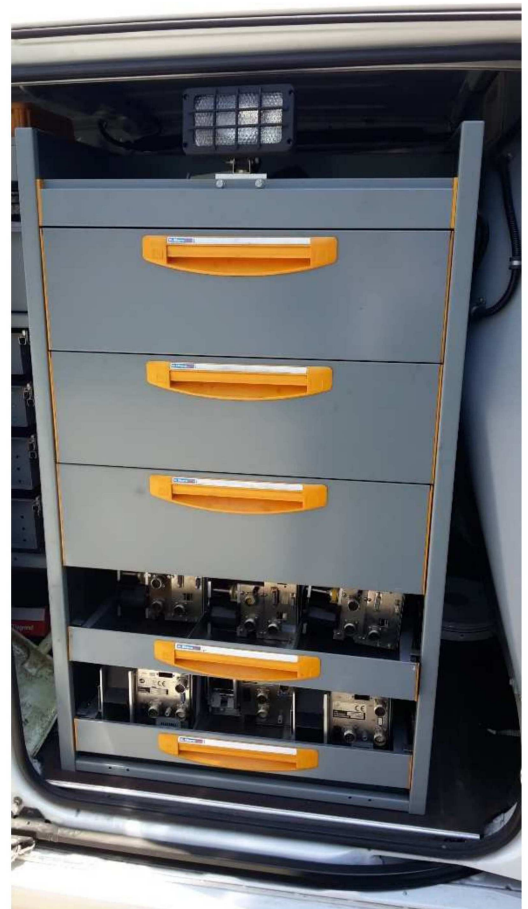
Figura 9 - Vista Cassettiera Usufruibile da Porta scorrevole lato destro