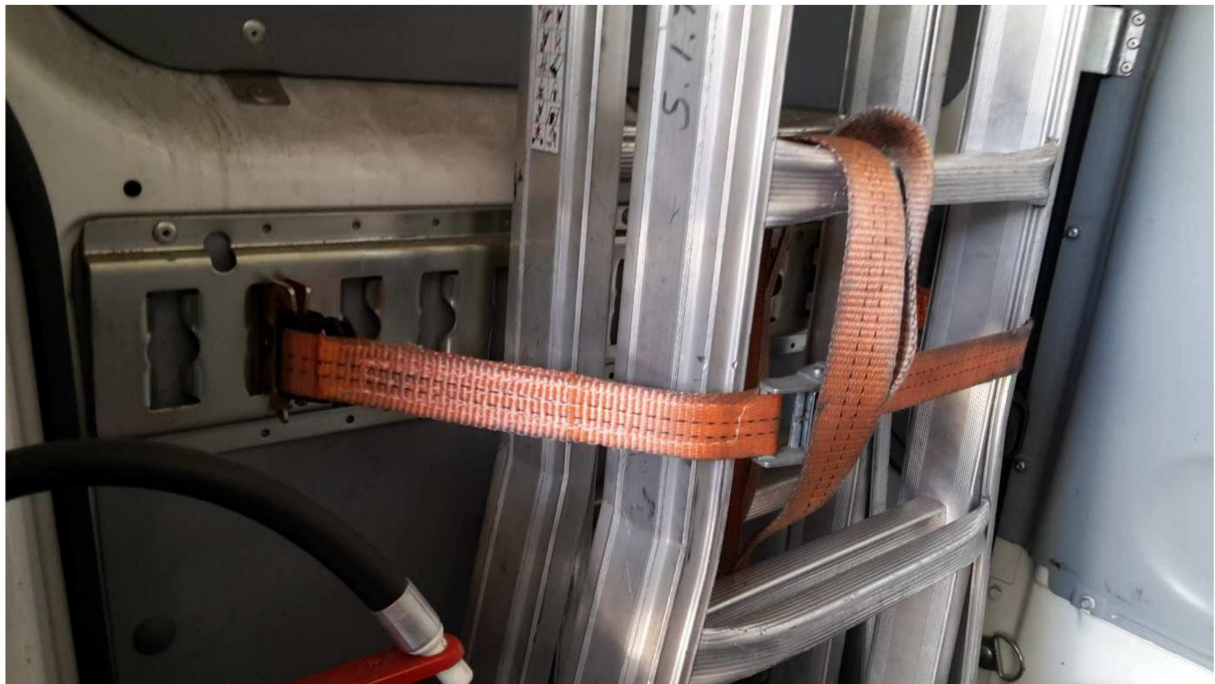
Figura 11 – Particolare Vano Carico lato Sinistro. Aggancio per cinghie in poliestere.