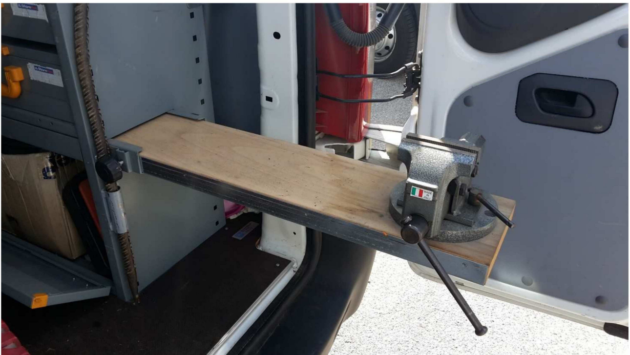
Figura 12 – Particolare Morsa