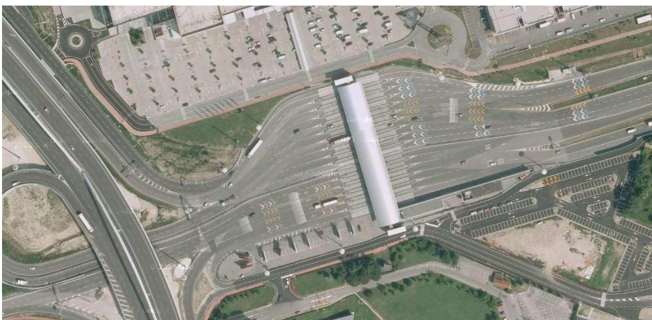
Piazzale autostradale di Padova Est